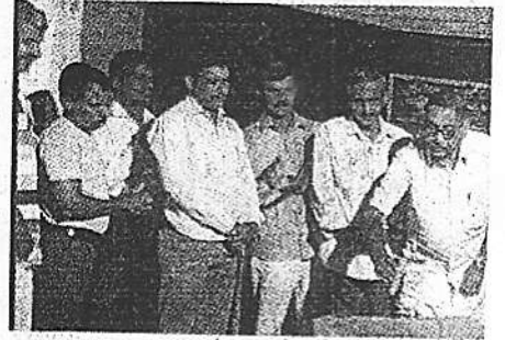
ಬೇಸರದ ಸಂಗತಿ ಎಂದರು.

ಅವರು ಕೇಸರಿ ಯುವ ಜನ ಸಂಘ (ರಿ) ಇವರು ಕನ್ನಡ ಮತ್ತು ಸಂಸ್ಕೃತಿ ಇಲಾಖೆಯ ಆಶ್ರಯದಲ್ಲಿ ಕೋಟಿ ಕಲಾಪೀಠದ ಸಹಕಾರದೊಂದಿಗೆ ಇತಿಲೇಖೆಗೆ ಯಡವಳಿಸಿ